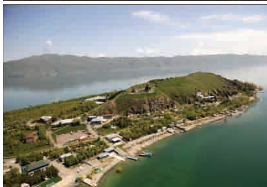
Սևանա կղզին 1930-ական թթ. և թերակղզին ներկայումս Sevan Island in the 1930s and at present, as turned into a peninsula