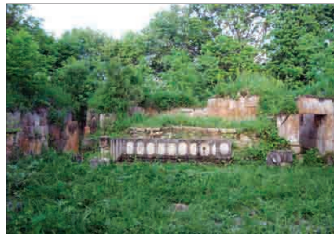
Գետիկի ամրոցը (Ժ-ԺԳ դդ.) և Խամշի վանքը (ԺԲ դ.) The castle of Getik (10th to 13th centuries) and Khamshi Monastery (12th century)