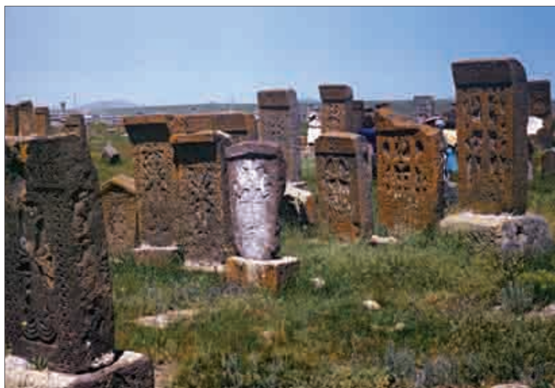
Նորատուս գյուղի խաչքարերով զերեզմանոցը, Թ-ԺԷ դարեր A cemetery of cross-stones (9th to 17th centuries), Noratus Village