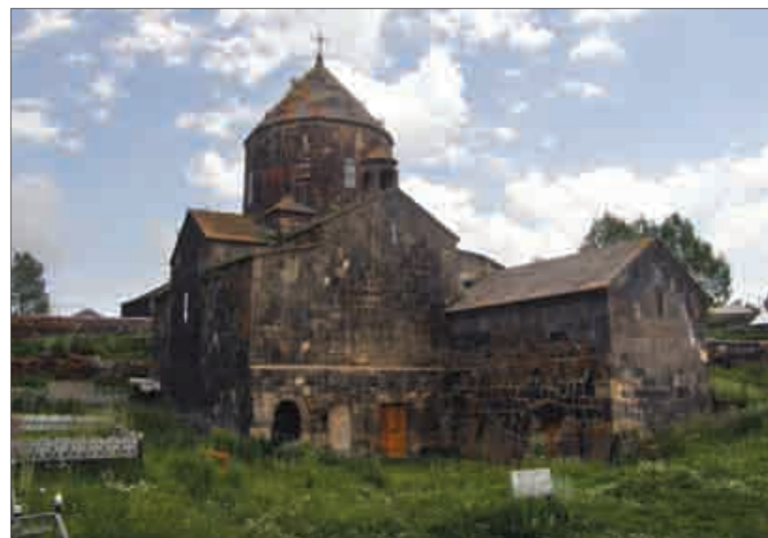
Սևանի թերակղզու վանքերը (Ժ-ԺԱ դդ.) և Մաքենյաց վանքը (Է-Թ դդ.) The monasteries of Sevan Peninsula (10th to 11th cents.); Makenyats Monastery (7th to 9th cents.)