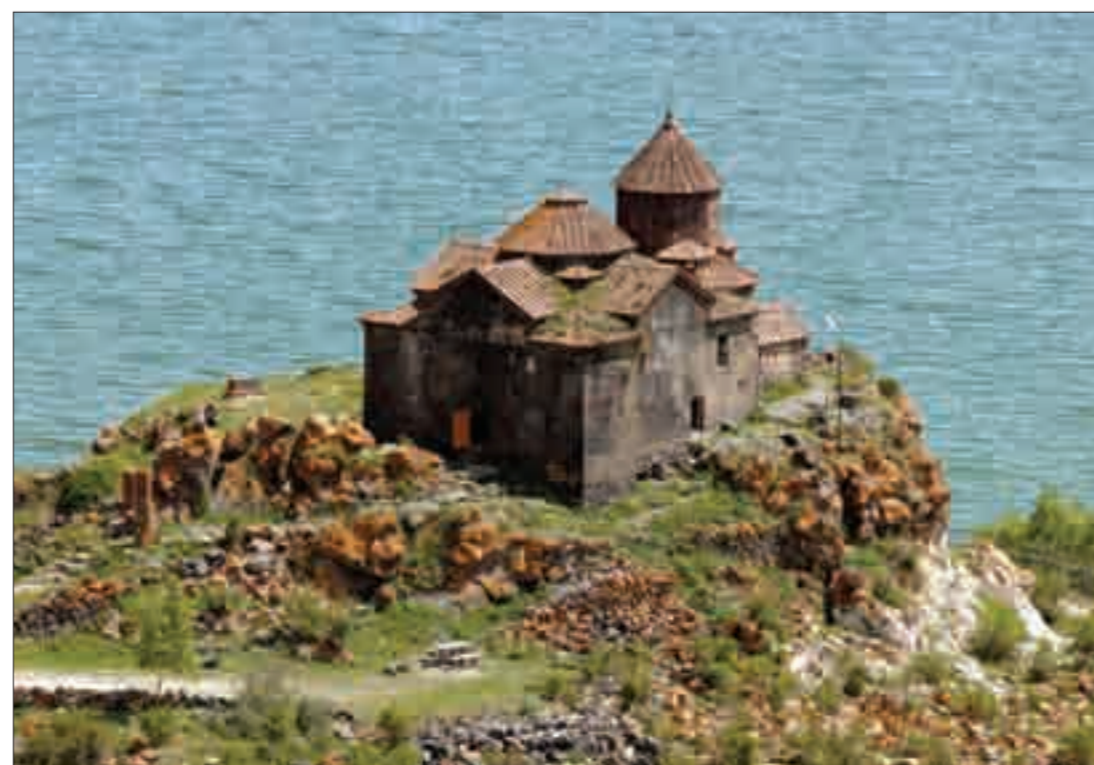
Բերդկունք գյուղի ամրոցը (մ.թ.ա. Գ հազ. - ԺԳ դ.) և Հայրավանքը, Ժ-ԺԳ դդ. The castle (3rd mill. B.C. to 13th c.) of Berdunk Village; Hayravank Monastery (10th to 13th cents.)