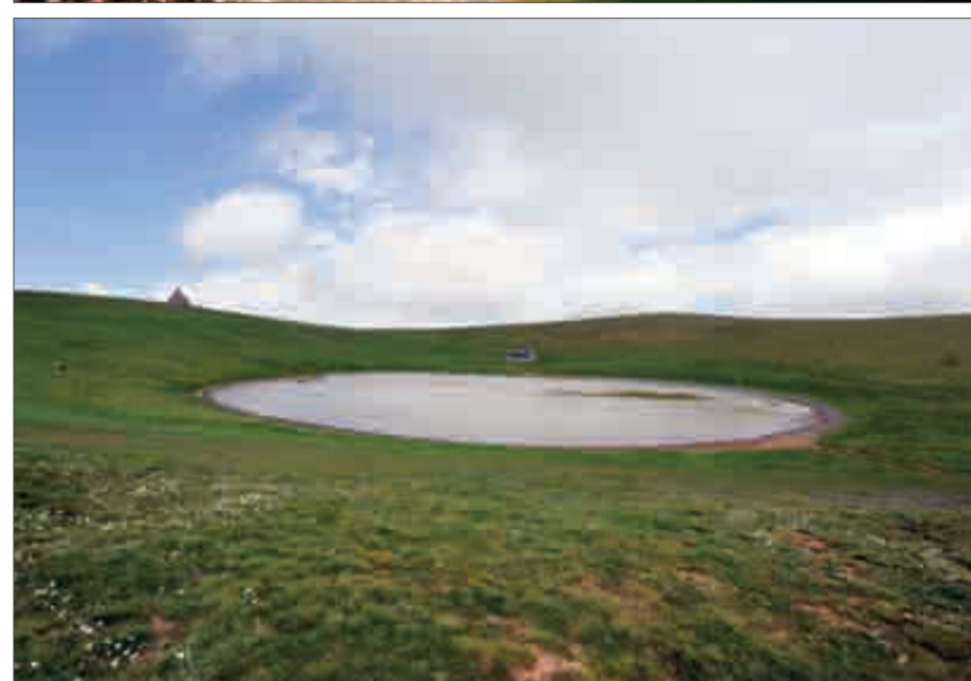
Հատված Սևանա լճից և Արմաղան լեռան խառնարանը A partial view of Lake Sevan; the crater of Mount Armaghani