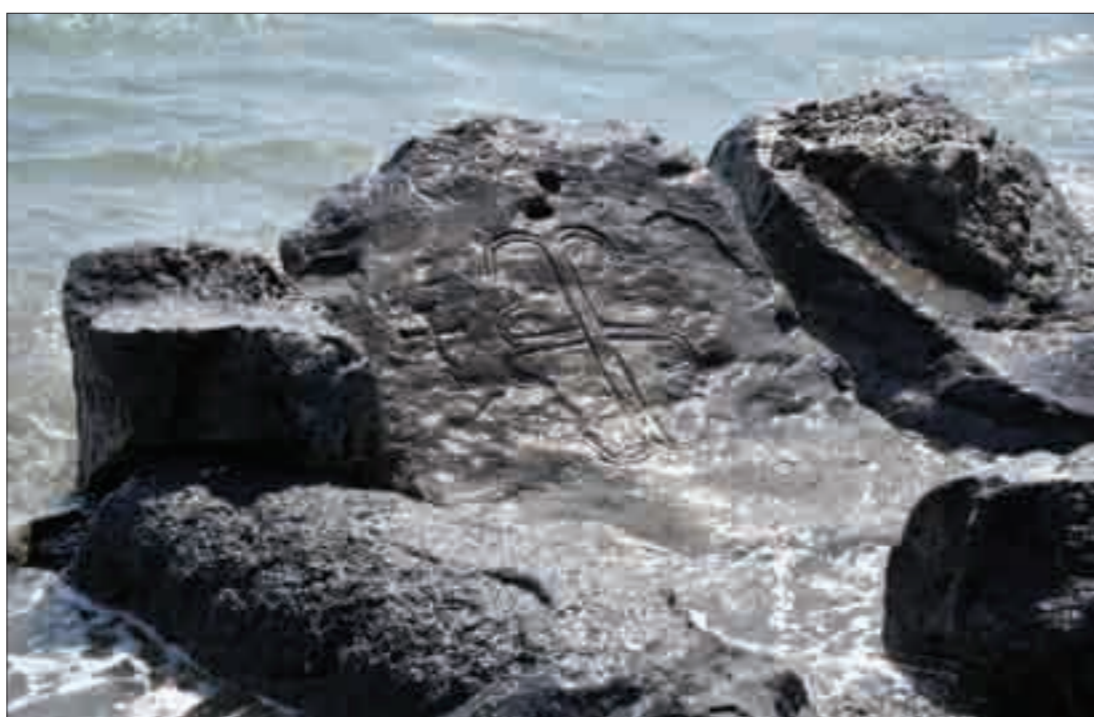
Մրանչկագործ վանքը, Արջրա գյուղի ծովակույ գերեզմանոցի խաչքարերից մեկը The monastery of Skanchelagortz; one of the cross-stones of the sunken cemetery of Arjra Village