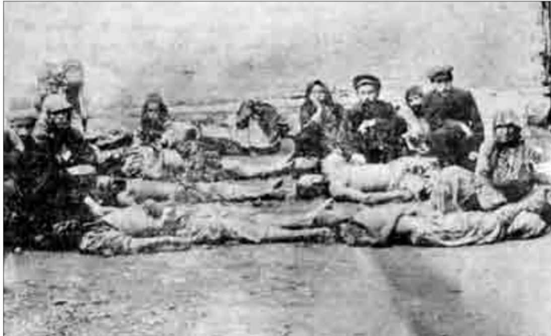
Արծկեցի հայ ընտանիք, 1908 թ. քլոդերի ձեռքով սպանված 6 արծկեցիներ An Armenian family from Artzke; the bodies of 6 Armenians from Artzke killed by Kurds