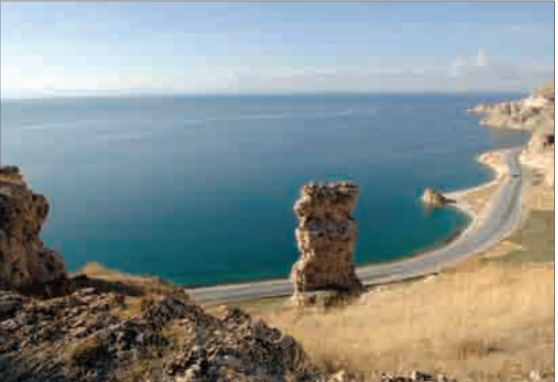
Սիփան (Նեխ Մասիք) լեռը (4058 մ) և Վանա լիճը, տեսարան Արծկեի բերդից Mount Sipan (Nekh Masik, 4,058 m) and Lake Van; the lake as seen from the castle of Artzke

Արծկեն գտնվում է Մեծ Հայքի Տավրոբերան (Տուրուբերան) աշխարհի (նահանգի) Բզնունյաց գավառի արևելյան հատվածում, որը զարգացած միջնադարում գտնվելով Բզնունիից՝ ձևավորվել է որպես առանձին գավառ: Տարածված է Վանա լճի հյուսիս-աային ափին և սկսվելով Կափեզից՝ հասնում է մինչև Սիփան լեռան գագաթով ձգվող ջրբաժան գիծը: Մ.թ.ա. 18-2 դարերում Վանի թագավորության կարևոր և պաշտպանական ամրություններով հորացված տարածաշրջաններից էր: Է դարում գավառը նվաճում և ավերում են արաբները: 885-1001 թթ. Արծկեն մաս է կազմում Անիի Բագրատունյաց, իսկ դրանից հետո՝ Վասպուրականի թագավորության (մինչև 1021 թ.): Այնուհետև նվաճում են բուրք-սելջուկները, որոնց էլ հաջորդում են բուրքնենական ցեղերը: ԺԷ դարում գավառն ապաստակում, իսկ բնակչությանը բռնագաղթի են ենթարկում պարսիկները: Չնայած դարից դար ճաշակած արհավիրքներին՝ 1915 թ. ցեղասպանության նախօրեին Արծկե գավառը դեռևս գլխավորապես բնակեցված էր հայերով, որոնց մեծագույն մասը բնաջնջվում է ապրիլի 6-8-ն ընկած ժամանակահատվածում: Գավառն առանձնապես հայտնի էր բարձրորակ ցորենով, որն արտահանվում էր նաև հարևան գավառներ: Այժմ նշանավոր է իր ընկույզով: Արծկեն հարուստ էր հայկական նյութական մշակույթի բազմադարյան և տարաբնույթ հուշարձաններով, սակայն դրանց հիմնական մասն անցած տասնամյակների ընթացքում նույնպես ոչնչացվել է: Մույն քարտեզ-ուղեցույցը հասցեագրում ենք պատմական հուշարձաններով հետաքրքրվող հայ և օտար հանրությանը: