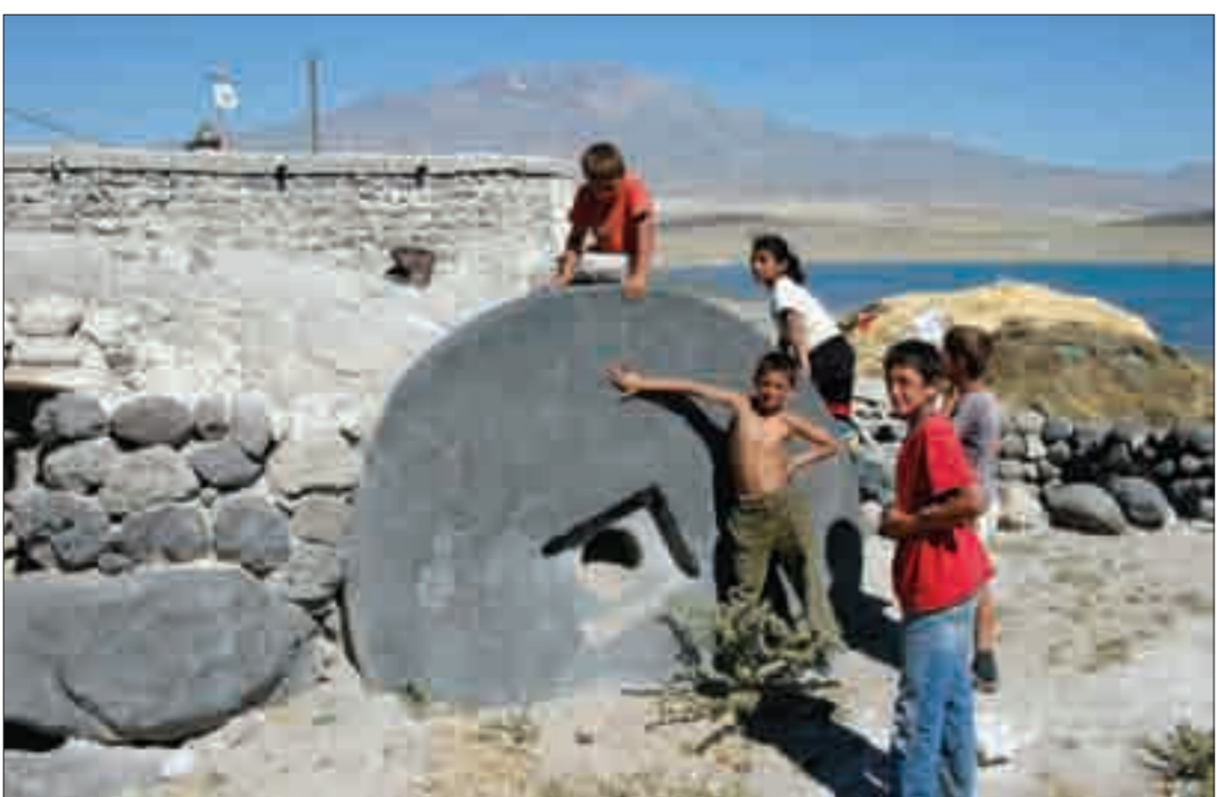
Արծկե (Ադիլցևազ) քաղաքն ու բերդը, ձիփանաքար Խոռանց գյուղում The city of Artzke (Adilcevaz) and its castle; an oil press stone in Khorants Village