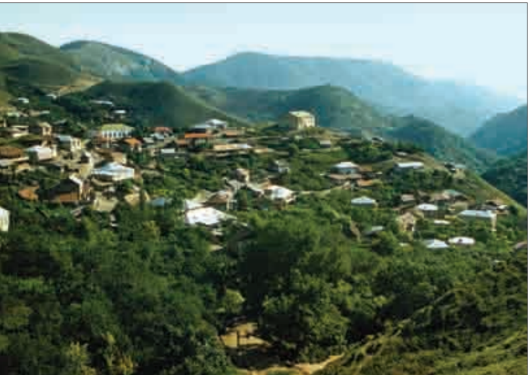
Բռնագավթված Շահումյանի շրջանի Վերիշեն և Գյուլիստան գյուղերը Verishen and Gyulistan Villages in the occupied district of Shahumian