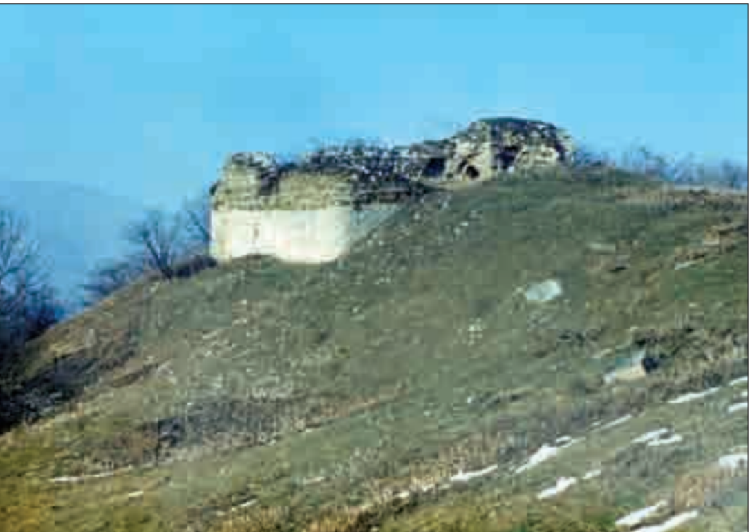
Գյուլիստանի (Հերգա) բերդն ու Երից մանկանց վանքը Շահումյանի շրջանում Gyulistan (Herga) Fortress and Yerits Mankants Monastery in the occupied district of Shahumian

«Մրավականք»-ը ներկայացնում է Արցախի Հանրապետության բռնագավթված և ազատագրված Շահումյանի անվան զույգ շրջանները։ Առաջինը տարածվում է Մռավի լեռնաշղթայի հյուսիսահայաց փեշերին՝ Փոքր Կյուրակ և Ինջա գետերի միջնահատվածում և ղեռև վաղ միջնադարում տարրալուծված էր Մեծ Հայքի Մեծ Կուսան (Արցախ նահանգ) և Ուտի-Առանձնակ (Ուտիք նահանգ) գավառների միջնասահմանում։ Ջարգացած միջնադարում գավառն ավելի հայտնի էր Հերգ, իսկ ուշ միջնադարում՝ առավելապես Գյուլիստան անվամբ։ Ադրբեջանցիների հսկողության ներքո է անցել և հայաթափ եղել 1992 թ.։ Նույնամուն երկրորդ շրջանը տարածվում է Մռավի լեռնաշղթայի հարավահայաց փեշերին և ներառում է Տրտու գետի վերին հոսանքի ջրհավար ավազանը։ Միջնադարում առավելապես Չար կամ Վերին Խաչեն անվանը հայտնի արցախյան այս գավառը զուտ հայաբնակ էր մինչև 1720-ական թթ. կեսերը, որից հետո կամաց-կամաց այստեղ են ներթափանցում առավելապես քրդական ծագմամբ մահմեդական խաշնարած ցեղեր։ Խորհրդային կարգերի հաստատումից հետո մոսկովյան կառավարիչներն այս շրջանը, առանց նույնիսկ ԼՂԻՄ-ի մեջ ներառելու, միացնում են Ադրբեջանին։ 1993 թ. շրջանի ազատագրումը հնարավոր դարձրեց 1992 թ. բռնագավթված Շահումյանի շրջանից արտաքսված բնակիչների՝ այստեղ վերաբնակվելը։ Ընդ որում, ի պատիվ և ի հիշատակ բռնագավթված շրջանի՝ ազատագրված Քարվաճառի շրջանը վերանվանվեց Նոր Շահումյան։ Սույն ուղեցույցը հասցեագրում ենք պատմական հուշարձաններով հետաքրքրվող հայ և օտար հանրությանը։