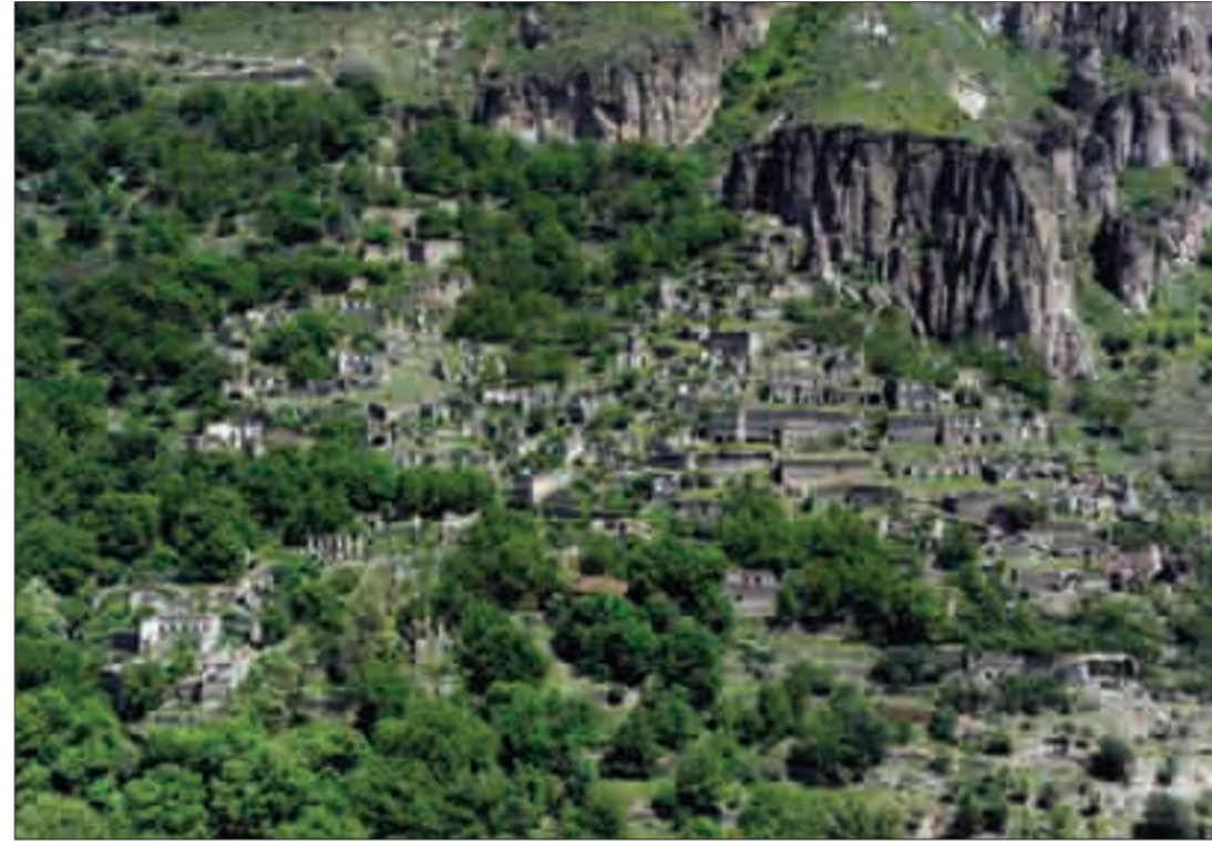
Շաքիի ջրվեժը և Հին Խոտ գյուղը The waterfall of Shaki and the village of Hin (Old) Khot