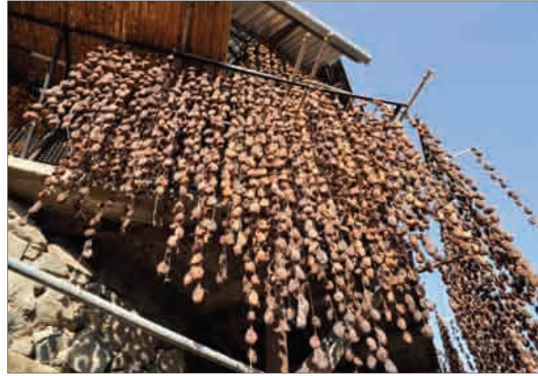
Ուխտասարի ժայռապատկերները և դրվագ աշնանային Մեղրիից Petroglyphs from Mount Ukhtasar and an autumn scene from Meghri Town