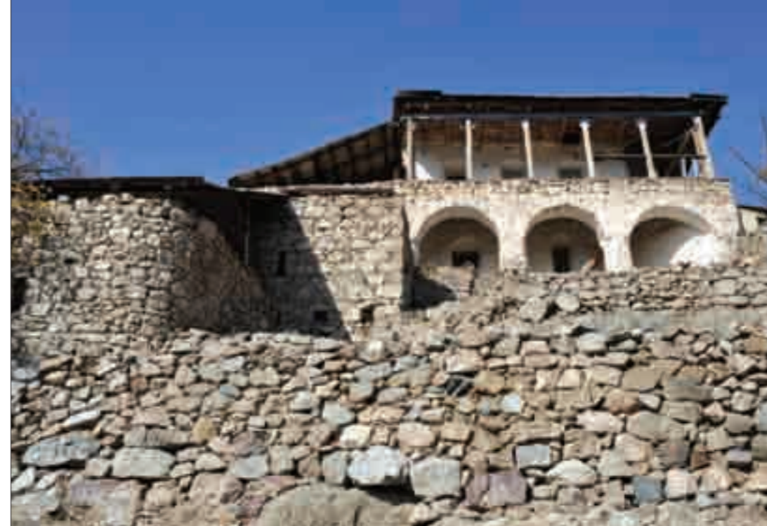
Բնակելի տներ Մեղրիի Փոքր թաղում և Շվանիձոր գյուղում (ԺԹ դարի վերջ) Houses in Pokr (Smaller) Quarter of Meghri Town and in Shvanidzor Village (late 19th century)