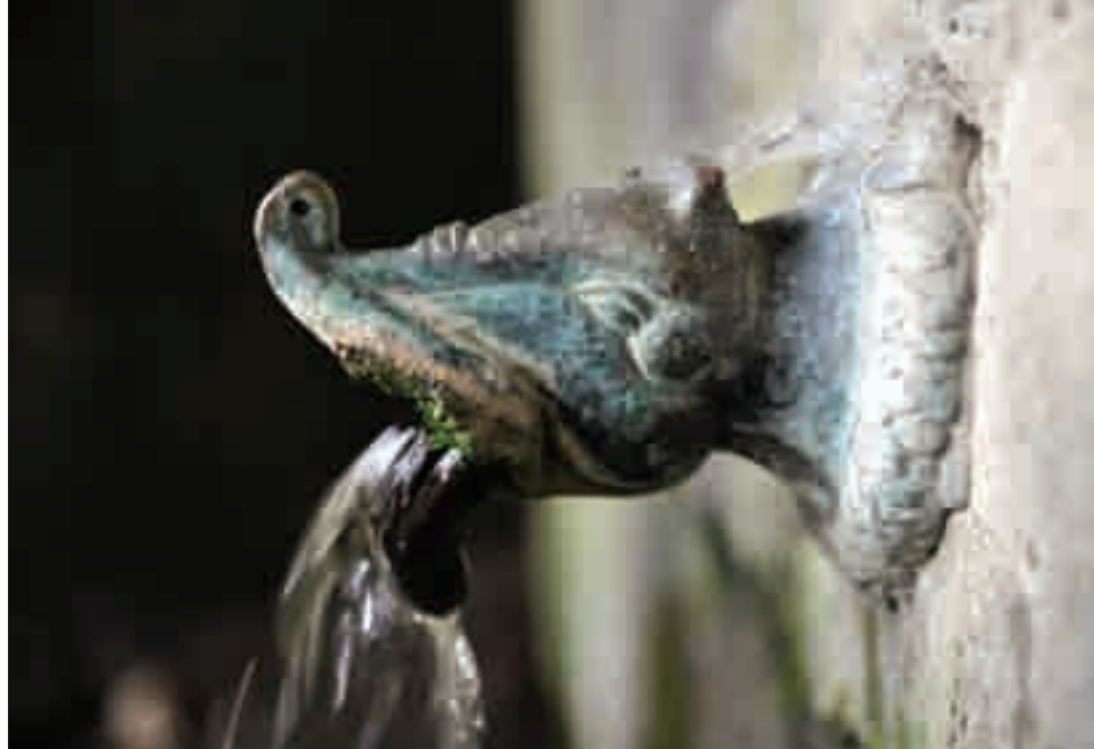
Մեգալիթյան հուշարձան Զորաց քարեր (Նորավան գղ.) և վիշապակերպ ծորակ (Տաթև գղ.) The megalithic monument Zorats Karer (Noravan); a dragon-head fountain spout (Tatev)