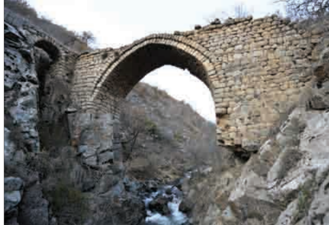
Շվանիձորի ջրանցույցը և կամուրջ (ԺԷ-ԺԸ դդ.) Մեղրի գետի վրա The aqueduct of Shvanidzor Village and a bridge (17th to 18th centuries) over the river Meghri