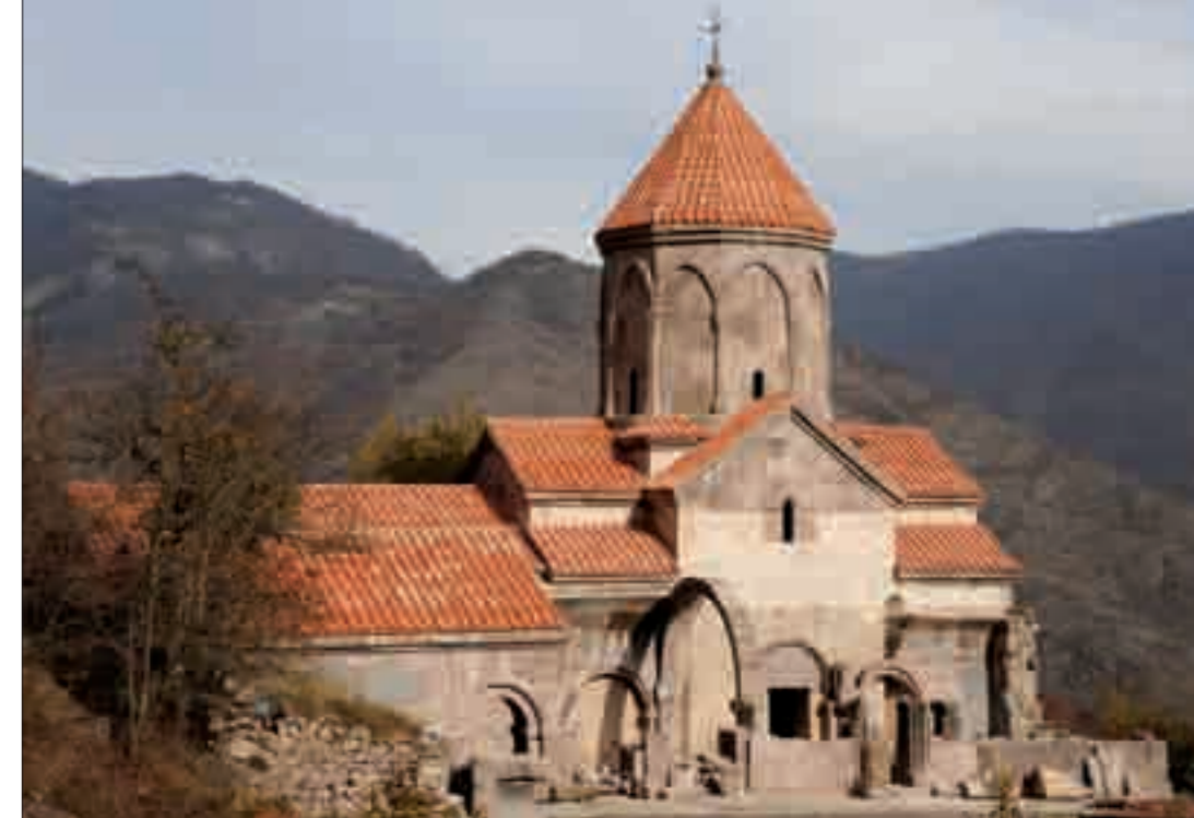
Տաթևի վանական համալիրը (Թ-Ի դդ.) և Վահանավանքը (Թ-ժԳ դդ.) The monasteries of Tatev (9th to 20th centuries) and Vahanavank (9th to 13th centuries)